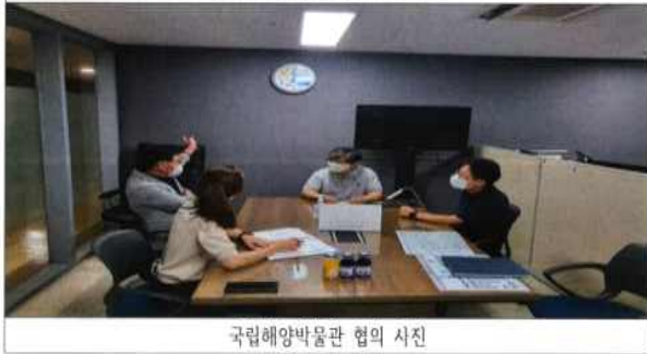
국립해양박물관 협의 사진