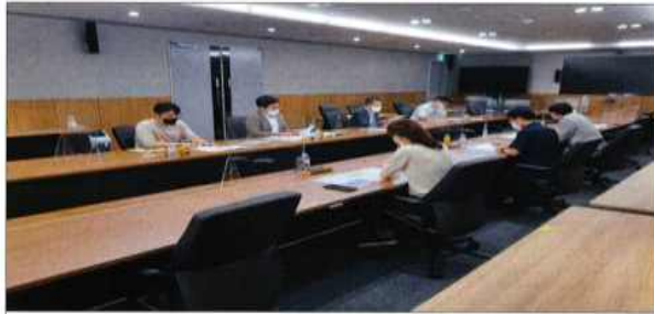
한국해양과학기술원 회의 사진