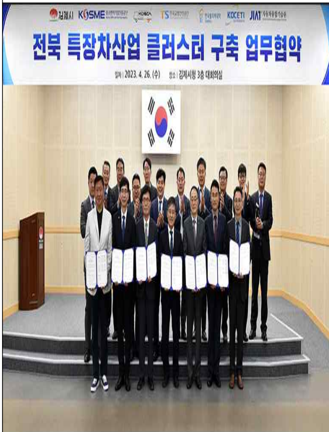
전북 특장차산업 클러스터 구축 업무협약식 ('23.4.26.)