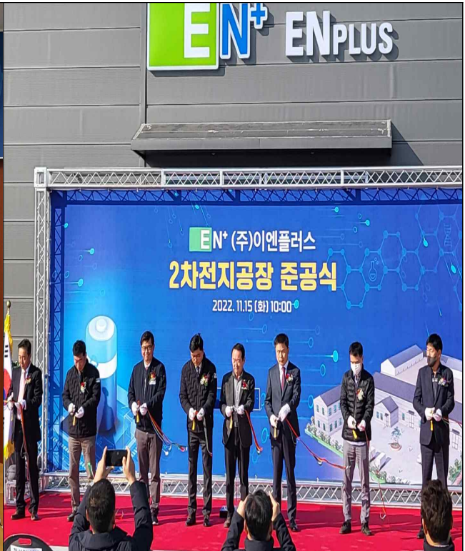
자유무역지역 이엔플러스 준공식 ('22.11.15.)