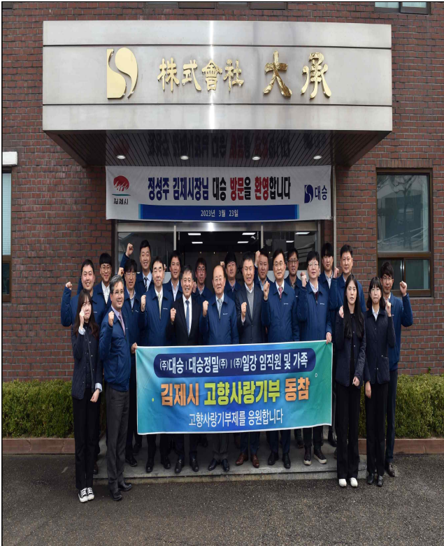
본사방문 (대승, 일강, 대승정밀)(‘23.3.23.)