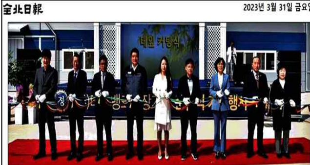
30일 김제자유무역지역 내 (주)티엠뱅크 특장기술 신규 공장 준공식에서 김제시 김제시장(오른쪽 4번째)과 관계자들이 테엠 커팅식을 하고 있다.