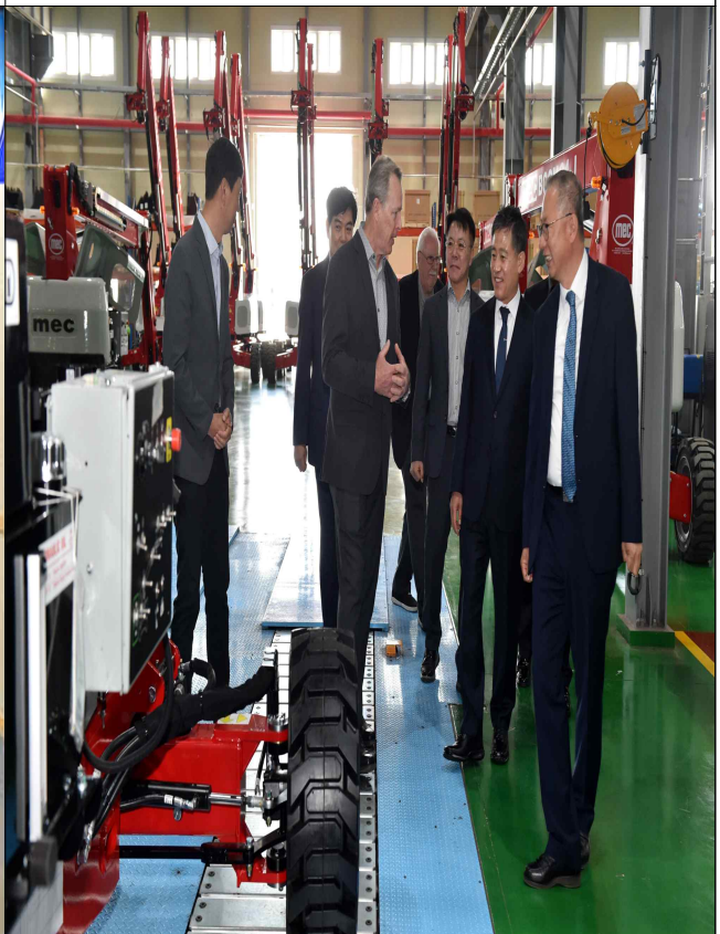
미국 건설기계 기업 MEC대표 김제공장(HR E&I) 방문('23.4.28.)