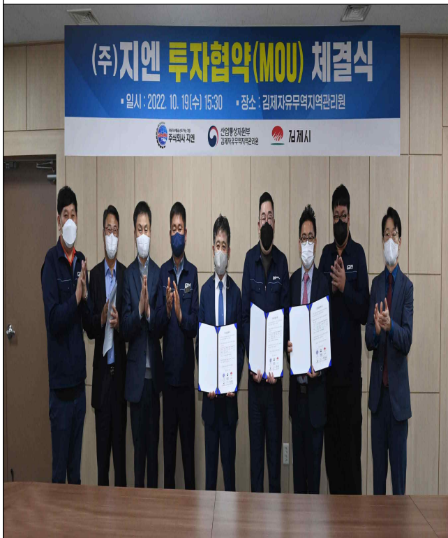
지평선산단(자유무역지역) 투자협약식 (주)지엔('22.10.19.)