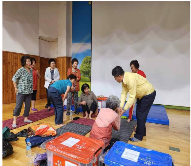
이재민 대피 현장(백구면)('23.7.15.)