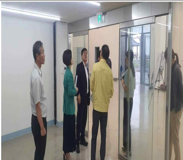
호우피해 현장(새만금지평선 커뮤니티복합센터 등)('23.7.18.)