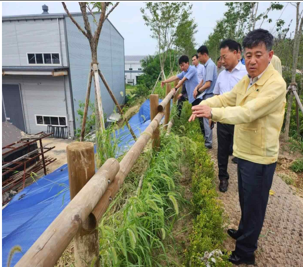
호우피해 현장(백구 특장차단지)(‘23.7.20.)