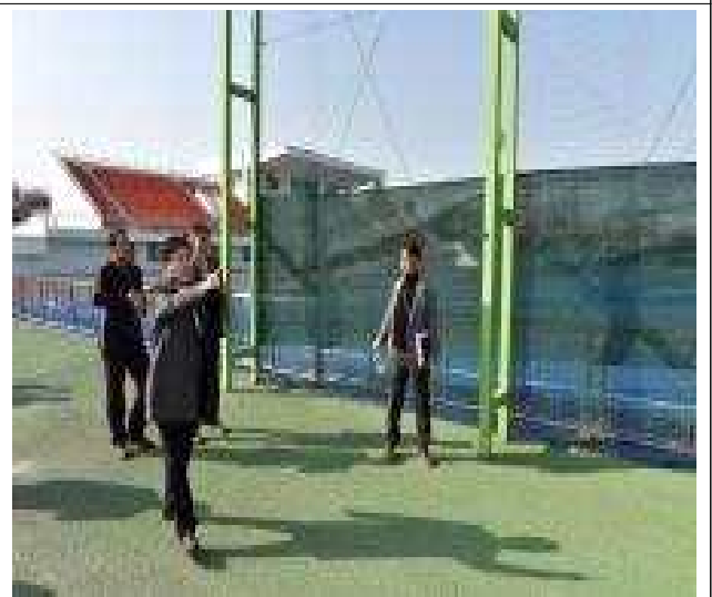
관내 체육시설 현장 방문('23.3.8.)