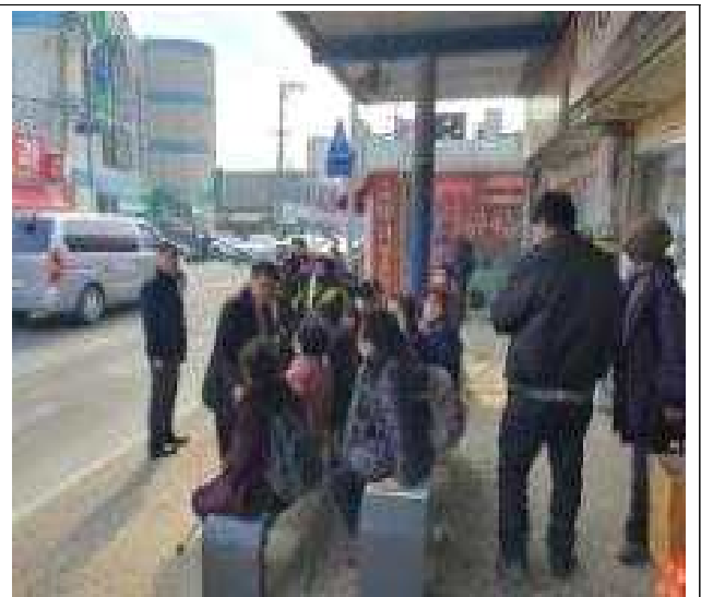
대중교통 휴게소 조성사업 현장('23.2.7.)