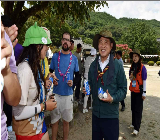
잼버리 영외활동 체험장(‘23.8.8.)