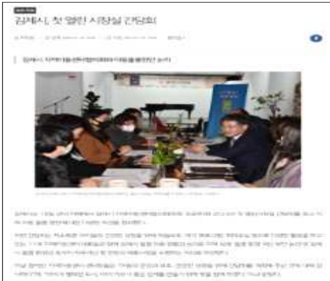
지역아동센터 관계자 간담회('23.1.18.)