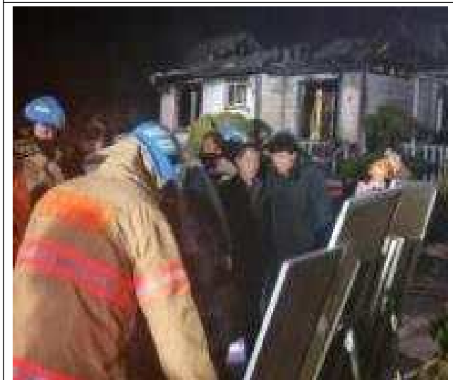
금산면 주택화재 현장 방문('23.3.6.)